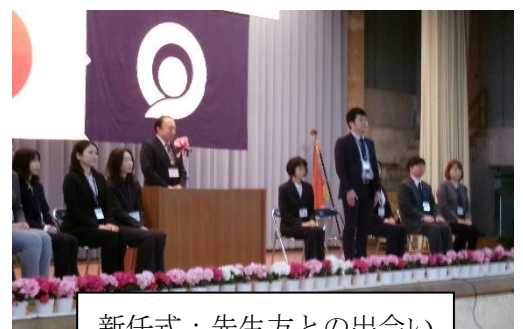
新任式：先生方との出会い

春は、新しい出会いの連続です。その一つ一つの出会いが、子どもたちの心を豊かにし、これからの人生を支える大切な力になっていくことでしょう。子どもたちが多くの出会いの中で学び、感じ、自分らしく成長していくことを、私たちは温かく見守り、支えていきたいと思ひます。今年度も、どうぞよろしくお願ひいたします。