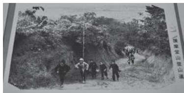
護摩堂山頂を目指す子どもたち

ふる里の貴重な歴史を記録として残したく、地元の方から提供いただいた写真をもとに「ふる里のなつかしい写真展」を開催しています。