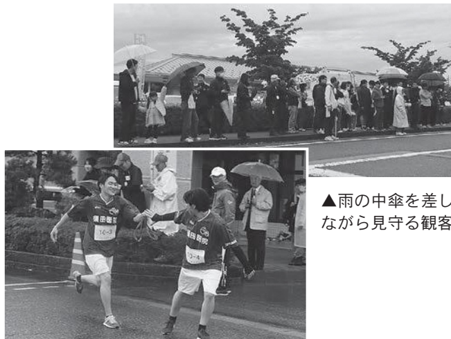
▲雨の中傘を差しながら見守る観客

あたたかな拍手に迎えられ、走り終えた選手の皆さんは、どなたも清々しい表情が浮かんでいました。