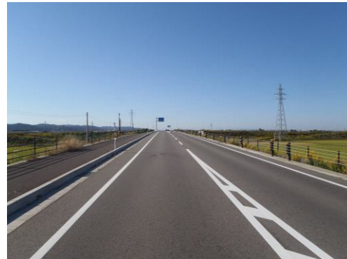
国道 403 号三条北バイパス R4. 12. 10 開通区間 (加茂市 下条地内)