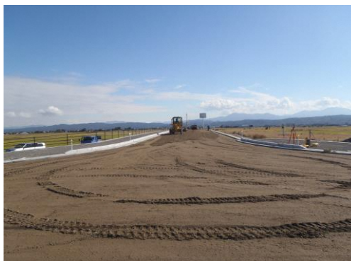
国道 403 号三条北バイパス R5. 10. 31 工事進捗状況 (三条市 県道塚野目代官島線付近)