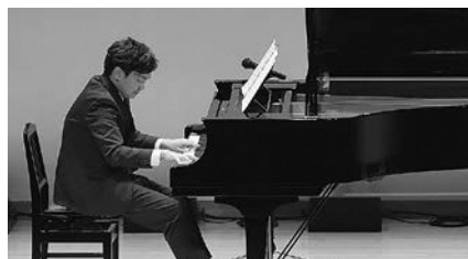
▲ピアノ演奏の様子