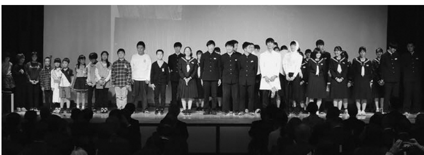
▲田上小学校、羽生田小学校、田上中学校の児童生徒代表の皆さん

発表された皆さんが町の事を学んで、町の中で感じて、自分たちでもできることをやっていきたいという想いが伝わってきました。発表後は会場内の皆さんから大きな拍手が送られました。