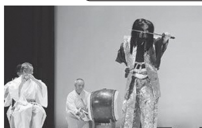
▲五社神社伶人会・神楽