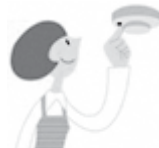
定期的な作動確認

作動確認をしても警報器に反応がなければ、本体の故障か電池切れです。警報器の本体又は電池を交換しましょう。