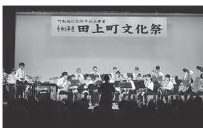
▲田上中学校・吹奏楽

『～輝くまち田上 21 世紀～虹のかけ橋 紫陽花は』の合唱の様子。ステージ上には、50 周年記念動画内で使用した音源収録にご協力いただいた皆さんが登壇されています。