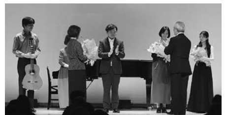
▲演奏後には町長から花束をお贈りしました