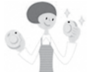
古くなったら交換