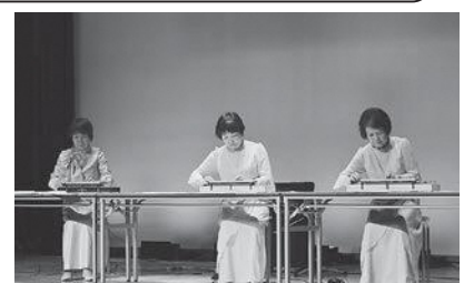
▲あじさい会・大正琴