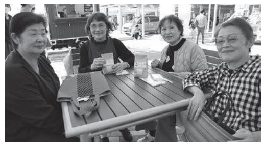
▲産業まつりを楽しむ皆さん