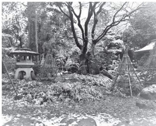
雪化粧をした三尊石