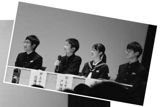
田上中学校 代表の皆さん