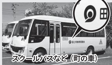
スクールバスなど（町の車）