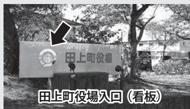
田上町役場入口（看板）