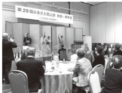
◀湯田上温泉ゆでや会による踊り

最後の総会・新年会では、54名の方が参加されお互いの近状報告やたくさんの思い出話で交流を図りました。会の最後には、“ふるさと”を全員で歌い、田上町へ思いを馳せました。