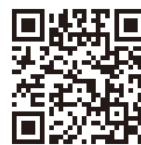
確定申告書等 作成コーナー

スマホ・パソコンから国税庁ホームページの「確定申告書等作成コーナー」を利用することで、次の3つの方法により簡単に確定申告ができます。詳細は、右のQRコードへアクセスしてください。