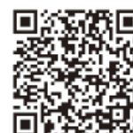
国税庁LINE 公式アカウント

問い合わせ：三条税務署 ☎32-6211（自動音声流れますので「0」番を選択してください。）