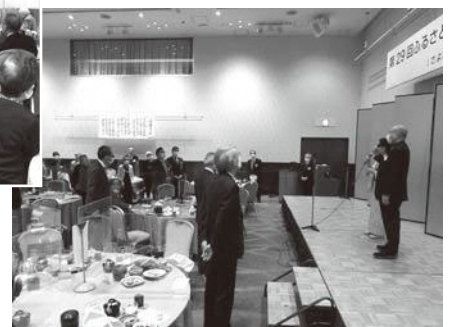
全員で“ふるさと”を合唱▶