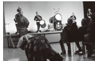
◀獅子や大黒様も登場されました