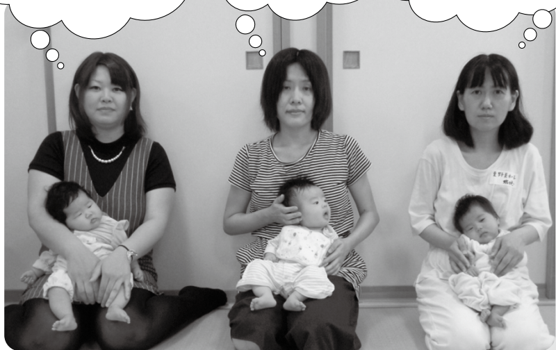
①母の名前 ②赤ちゃんの名前・読み方 ③名前の由来など