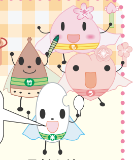
田上レンジャー (田上町食育推進キャラクター)