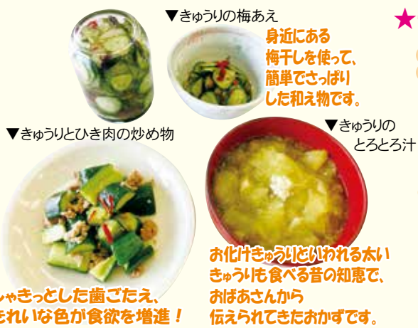
しゃきっとした歯ごたえ、きれいな色が食欲を増進！