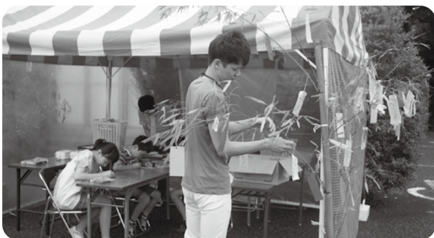
学生と一緒に七夕アートのワークショップを楽しむ子どもたち