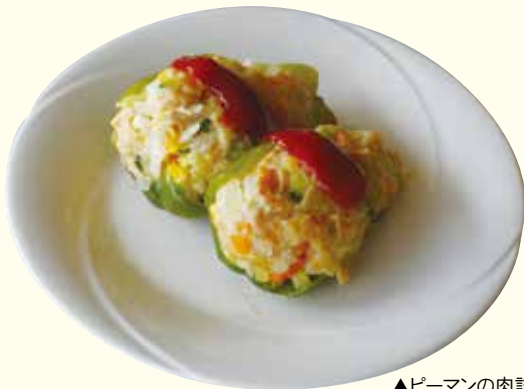
▲ピーマンの肉詰め

今月は、下横場地区食推が「ピーマン料理」を紹介します。ピーマンは、子どもには、人気のない野菜ですが、彩りよい野菜を使ったピーマンの肉詰めや、塩鮭と一緒に炒めることで、子どもにも美味しく食べられると思います。新鮮なピーマンは、カロテンやビタミンCが多く含まれ夏バテ予防に効果があります。特に、ビタミンCは1個で1日の4分の1がとれるほど多く含まれて、果肉が厚いため、加熱してもこわれにくい野菜です。