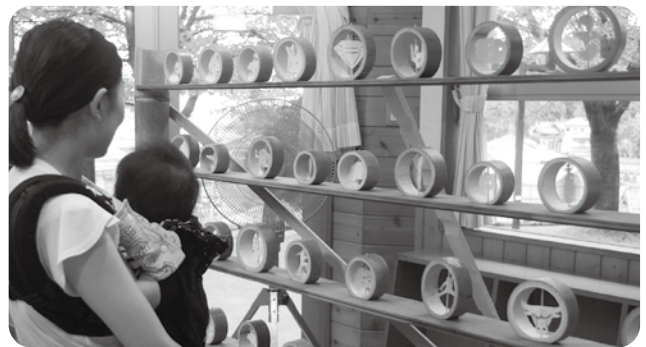
田上中学生が作成した竹のクラフト展示