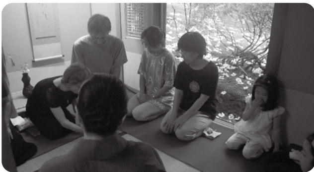
今年も人気の華蔵院のお茶会

また、今年も、学生も大勢参加してイベントを盛り上げてくれました。新潟経営大学はワークショップやウォークラリー、浴衣の着付け教室を実施。新潟中央短期大学は旅館「わか竹」で作品展を開催しました。学生が地域に入ることで、外部の視点・考え方から、地元の方々は、今まで見過ごしてきた地域のよさを改めて発見したようでした。参加した町外出身の新潟経営大学の学生からは、「イベントに参加するにあたり、事前に下調べを行いました。地域をよく知る事が大切だと実感しましたし、地域のみなさんと一緒に活動できて良かったです。」と参加した感想が聞かれました。 メインイベントは終了しましたが、20日までは、ご覧いただける会場もありますので、ぜひご来場ください。