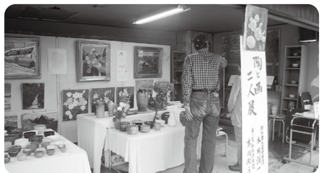
町内の作家の作品を展示