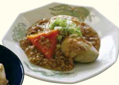
▲大根と里芋のそぼろあんかけ