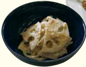
▼れんこんのごまマヨサラダ