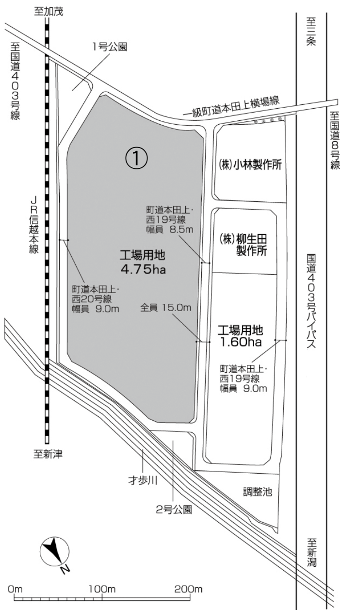
図：本田上工業団地平面図

本田上工業団地の第2期造成区画（図の①）を一括で取得した方に対して、 1億円 を助成します。（平成28年1月1日より制度を開始しました。）