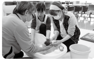
沐浴の方法を体験学習