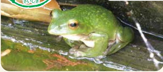
水辺にいたモリアオガエル