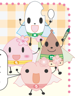
田上レンジャー (田上町食育推進キャラクター)