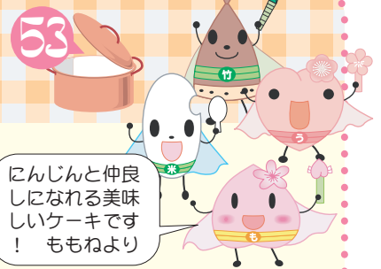
田上レンジャー (田上町食育推進キャラクター)

今回は、下吉田地区食推のおすすめ「にんじんケーキ」を紹介합니다。にんじんは存在感を出すためにすりおろさずに細いせん切りにします。パイナップルの缶詰やシナモンがちょうどよい香りのアクセントになってにんじん独特の味はあまりしません。にんじんのおやつを子どもたちと一緒に作ってみましょう。