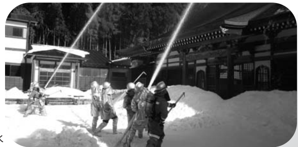
お堂に向けて一斉放水

1月20日、今年の中店の東龍寺にて放水訓練が行われました。足元に雪が残る中、文化財を守るため消防団は訓練に勤しんでいました。