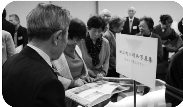
ふるさとの話で盛り上がる会員

会員は随時募集しています。関東近郊に在住する田上町出身で構成されており、皆さんのお知り合いでまだ会をご存じない方がいましたら、ぜひご紹介ください。