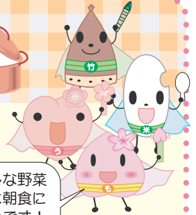
田上レンジャー (田上町食育推進キャラクター)

今月は、川の下地区食推おすすめめの夏野菜スープを紹介します。完熟トマトを煮込むことで、まろやかな酸味でさっぱりとしたスープです。野菜はスプーンにのる位のココロコに切るので、子どもにも食べやすいです。田上の野菜が大好きになるように、この夏にぜひ作ってほしい1品です。