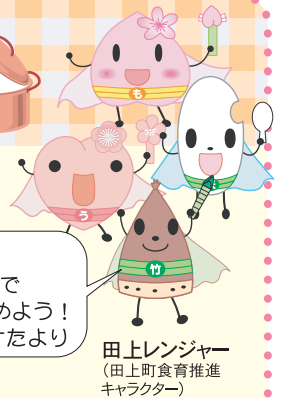
田上レンジャー (田上町食育推進キャラクター)

今月は、旬の筍としいたけが入ったお味噌汁です。朝は野菜が不足しがちですが、せめてごはんと具沢山の味噌汁だけは食べてほしいです。忙しい朝に手早く味噌汁を作るコツは、前の晩に行うひと作業です。下ごしらえした味噌汁の具が、調理時間の短縮に大きな役割をはたしてくれます。