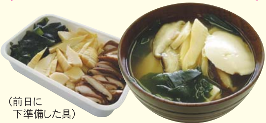
(前日に下準備した具)