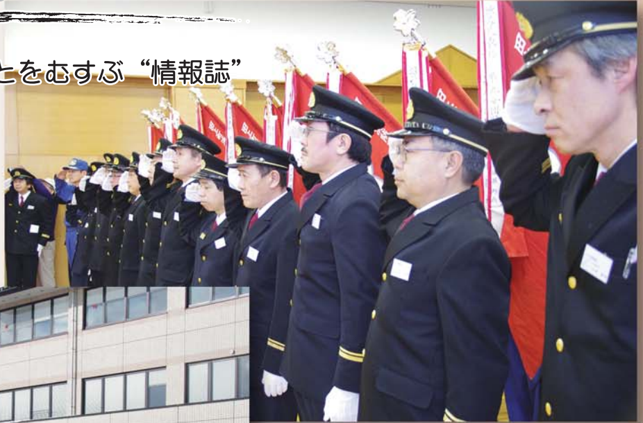
今年は女性消防団員も広報活動で参加