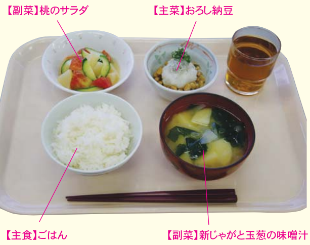
【副菜】桃のサラダ 【主菜】おろし納豆 【主菜】ごはん 【副菜】新じゃがと玉葱の味噌汁