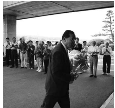
6月22日再任後の初登庁