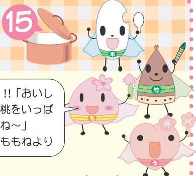
田上レンジャー (田上町食育推進キャラクター)

7月末から8月にかけて、農家の方が丹精込めて育てた桃が味わえます。田上の桃は、無袋(袋をかけない)栽培なので、太陽の光をたくさん浴びて甘く実ります。栽培されている主なものは「あかつき」という品種です。今回は桃をサラダに使ってみました。トマトやきゅうり、ドレッシングで和えるだけで、朝からさっぱりと食べられます。バランスのよい朝食、しっかりした睡眠で夏の暑さを乗り切りましょう。