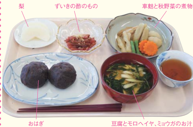
梨、ずいきの酢のもの、車麩と秋野菜の煮物、おはぎ、豆腐とモロヘイヤ、ミョウガのお汁