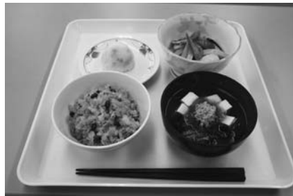
田上の食材を使った春の一食献立

毎月19日は「食育の日」 少なくとも、週1日は家族そろって 食卓を囲みましょう！