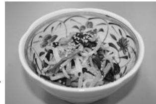
ほうれん草の和風マヨネーズ

毎月19日は「食育の日」 少なくとも、週1日は家族そろって食卓を囲んでみてはいかがですか!