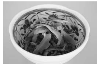
きんぴらそぼろ煮