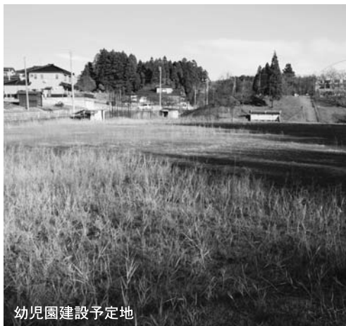
幼稚園建設予定地

います。今後は、幼児教育の力 キュラムや子育て支援センターの あり方といったソフト面の課題を 協議していきたいと考えています。 これまで田上町の教育は、竹の友 幼稚園での1年間と小中学校9年 間の義務教育の計10か年教育を 実施してきました。新しい幼稚園で は3歳児からの幼稚園教育を導入 する予定ですが、12か年の一貫教 育を検討していきたいと考えてい ます。これからの田上町の人材を 育成する基礎となる幼児園教育に 大いに期待していますし、将来の 田上町を担う人材が育つてほしい ものです。