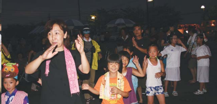
田上甚句に合わせて盆踊り(田上夏まつり)