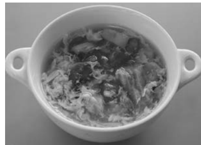
トマトと卵とレタスのスープ