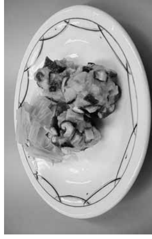
生しいたけシユウマイ