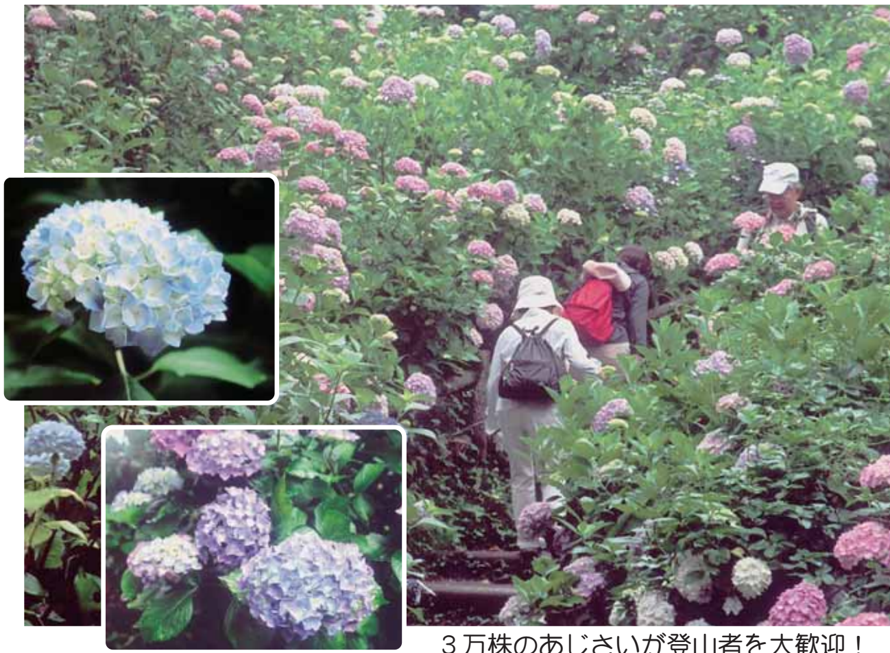
3万株のあじさいが登山者を大歓迎！ (護摩堂山頂)