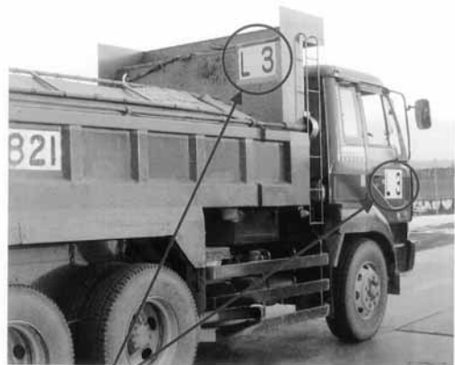
(例) L 3 背景色 : 黄色は信濃川下流河川堤防工事の色(信濃川下流河川事務所発注) アルファベット : 工事別の記号 数字 : ダンプトラックの管理番号

なお、信濃川堤防工事のダンプトラックには黄色地にアルファベットと数字が書かれた専用の識別プレートを装着し、安全運転の周知徹底を指導していますが、お気づきの点がありましたら下記までご連絡ください。