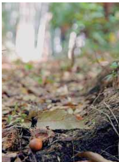
おこしやま 『追越山遊歩道』

追越山遊歩道は手軽な遊歩道として「癒しロード」と名付けられており、コースは短いですが魅力的です。