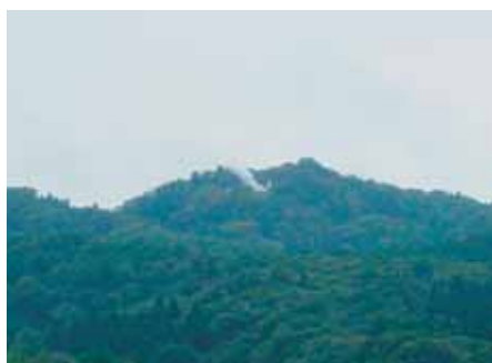
国道403号線田上駅前付近から

▽10月20日、「にいがた狼煙プロジェクト」というイベントが行われました。中世においては通信手段の一つだった「狼煙上げ」。今回は県内各地の山城・砦跡から、中越や柏崎の復興を祈念して行われ、護摩堂山からも狼煙が上がりました。目撃された方はいたでしょうか？