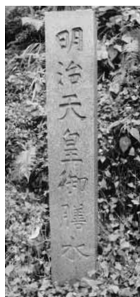
投稿：吉沢和平(上野)

※「ふれあい広場」の目的上、投稿いただいたものも掲載できない場合がありますので、ご了承ください。