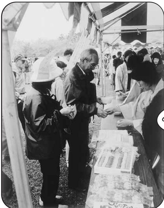
売店が並びました!