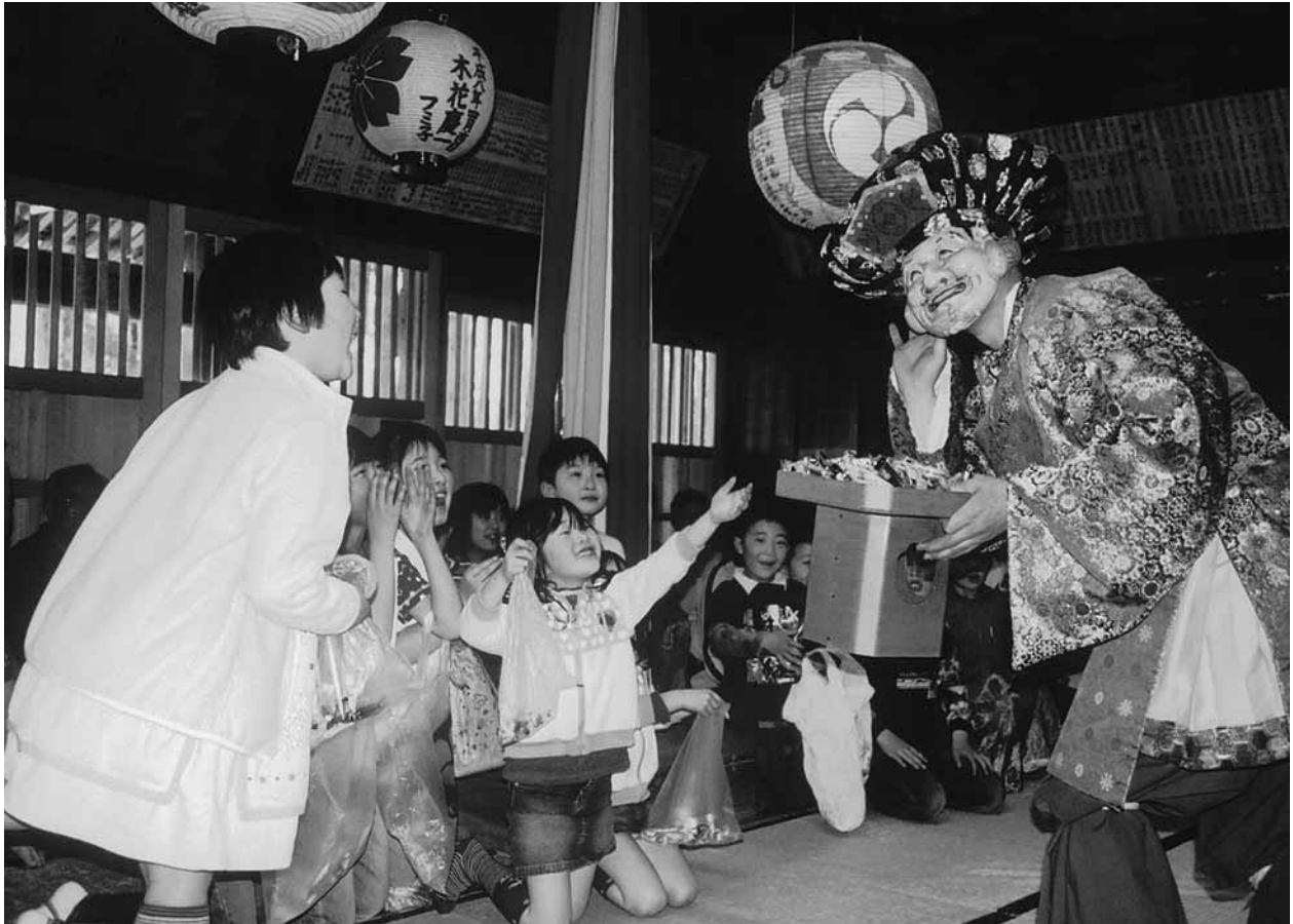
「こっち、ちょうだ〜い！」(湯川五社神社神楽) (6ページの『たうん情報』もご覧ください)