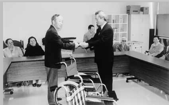
あじさいの里に車椅子2台 田上アルミの会が寄附

田上アルミの会から、あじさいの里に車椅子2台の寄附がありました。田上アルミの会は、空きアルミ缶を回収し、その収益金を特別養護老人ホームなどへ寄附する活動を続けているボランティア団体です。平成7年の設立以来、毎年、車椅子などの各種器具を寄附しており、あじさいの里からも大変喜ばれています。これからも益々ご活躍ください。