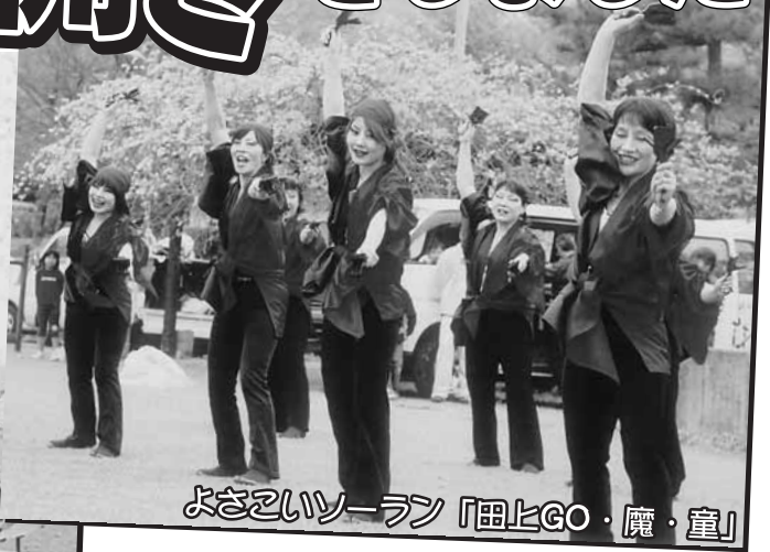
よざいイソーラン「田上GO・魔・童」