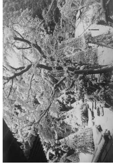
越後家農の館 「椿寿荘庭園」