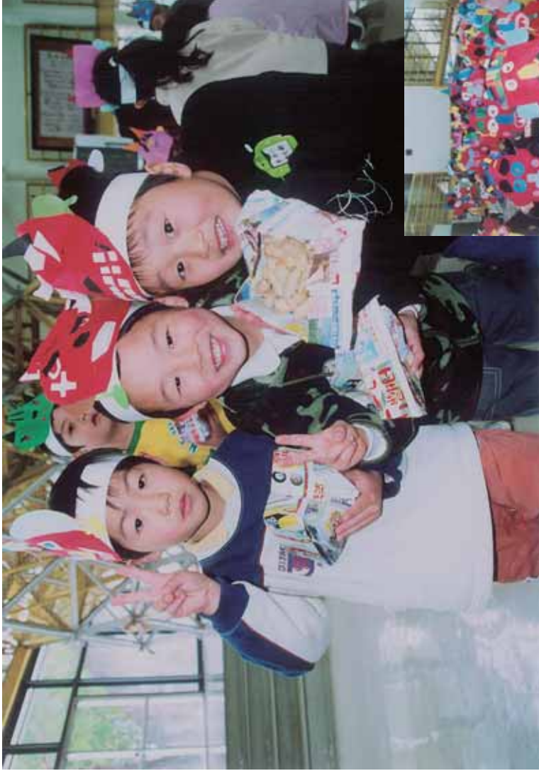
笑った赤おに (竹の友幼稚園の節分集会)