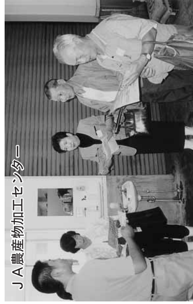
JA農産物加工センター

◆田上町周辺にもまだまだ自分の知らない、企業や大学など素晴らしいところがあることを知るとともに、田上の住民として胸を張れる思いがします。