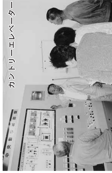
カントリーエレベーター

◆一人ではなかなか見ることのできないところでも、モニター施設見学を通して知識が広がり、ありがたく思いました。