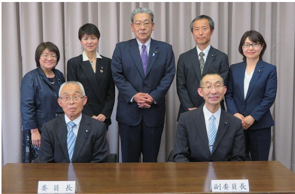
▲新メンバーで編集します!

県内の全市町村をもって組織され、事務所は県自治会館内にあります。後期高齢者医療制度の事務を行う特別地方公共団体です。