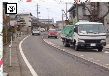
③ 交通量が多いが、車道路肩が狭く歩道も未整備であるため危険