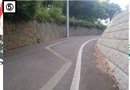
⑤ 通学路にて外側線が消えており危険であ