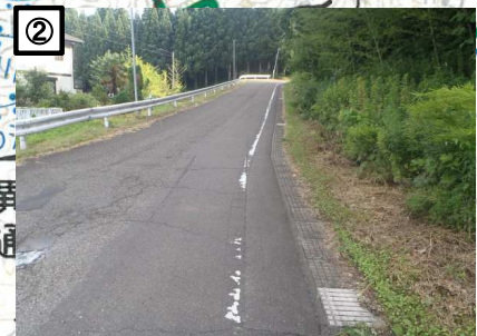
② 通学路にて側溝蓋がなく危険