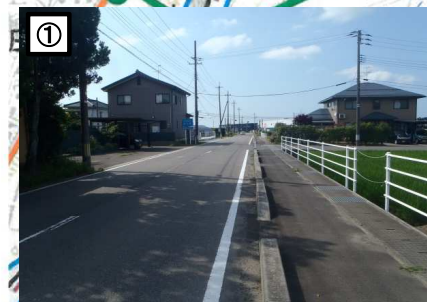
① 歩道がない通学路で交通量が多く危険