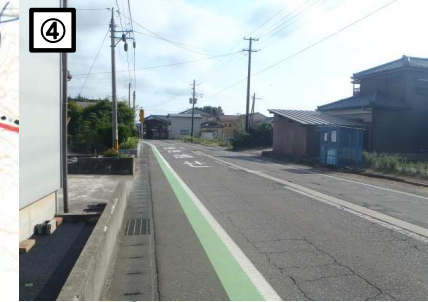
④ 交通量が多いが、車道路肩が狭く歩道も未整備であるため危険