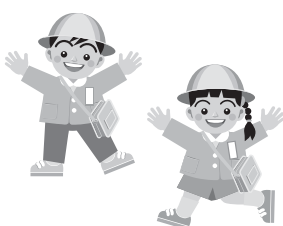
▲「ピーカブック」保育支援ソフト販促物より引用