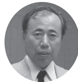
斎藤 勲 議員