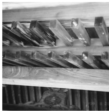
▲虫喰いが目立つ椿寿荘の玄関のタル木

新潟県の指定文化財に指定されると、大規模な修復には補助金が出るようになっていきます。町として指定を受けるようにすべきではありませんか。