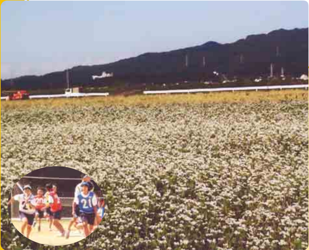
▲ 実りの秋 (川前地区よりソバ畑をのぞむ)