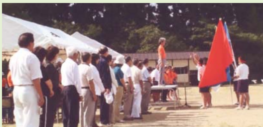
▲中学校運動会開会式