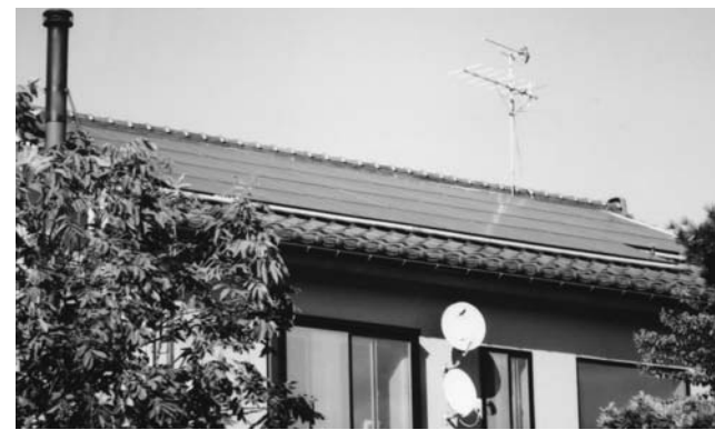
▲田上町の一般住宅に設置された太陽光発電