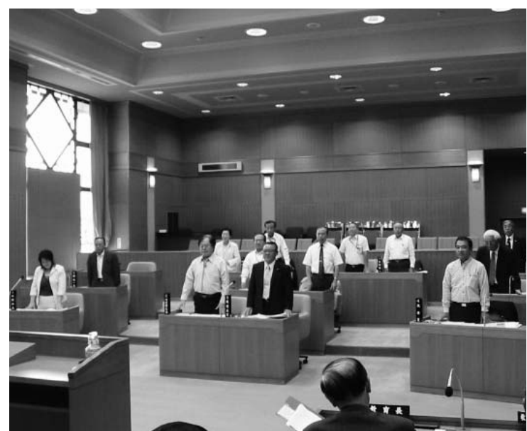
▲ 人事案件の起立採決

○R403バイパスの今後の進め方について 早期供用開始を図るために、未買収区間を4車線買収から2車線買収に計画を変更する。 ○非常勤特別職の報酬改定について