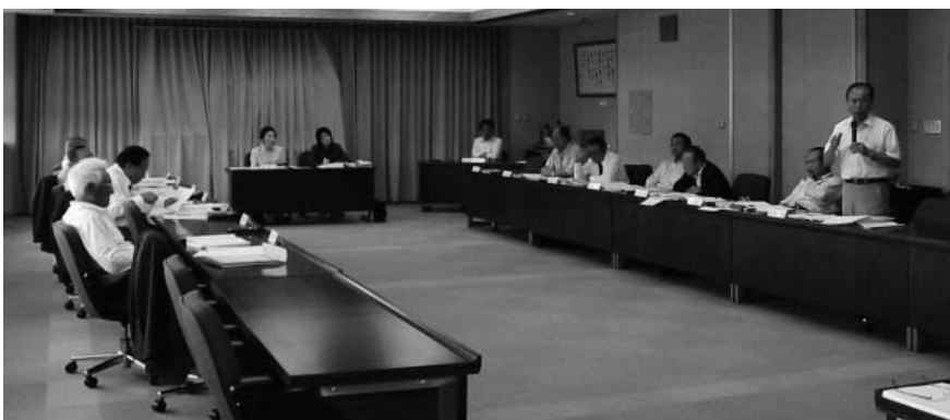
▲ 白熱する決算審査特別委員会