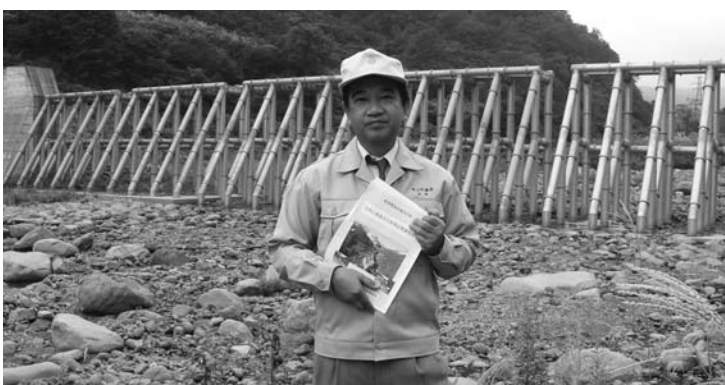
▲スリット型砂防ダム

町長 町内には土石流の危険渓流24カ所、急傾斜地の崩壊危険箇所9カ所があります。県は今年8月から12月にかけて現地調査を行い、その結果に基づきまして土砂災害警戒区域等の公示手続を行う予定と聞いておりますので、今後はさらに土砂災害に対するハードあるいはソフト両面の具体的な対策が可能になるものと思っております。