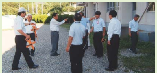
▲メジャーを使って武道場建設予定地を調査