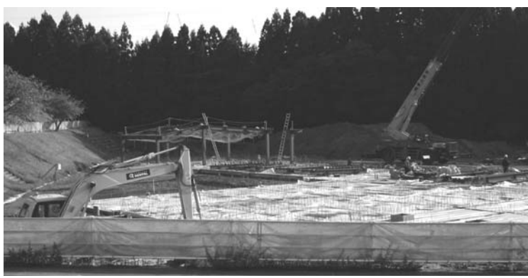
▲開園に向けて工事中の竹の友幼児園