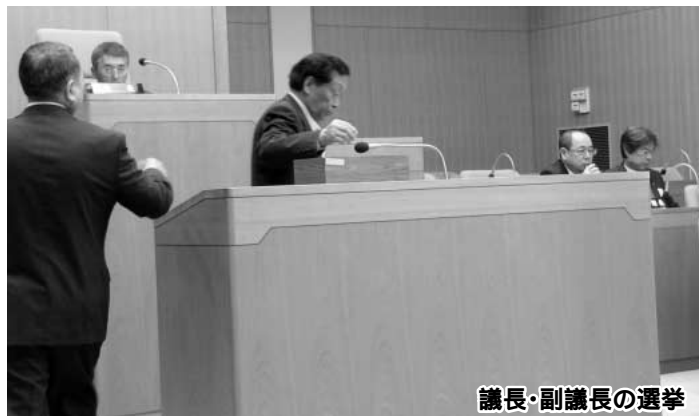
議長・副議長の選挙