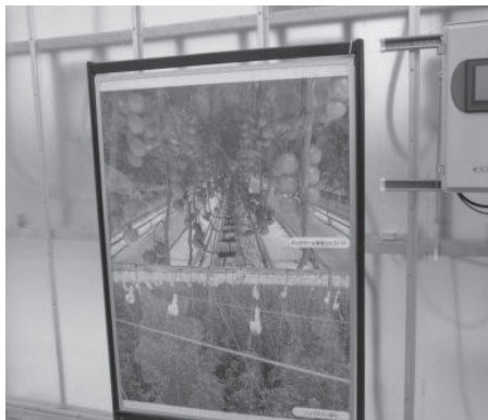
▲トマト栽培のハウス

ということですが。現在、輸出が8割を占めており、アメリカ・タイ・フランスなどに輸出されています。生産ラインはいろいろな機種が順次流れる混流ラインでした。エンジン組立の様子は、テレビドラマでも使用されたことでした。今回の研修では、日本の農業に関する様々な最新の技術に触れ、日々進化していることを感じました。