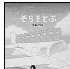
(ノラネコぐんだん そらをとぶ)