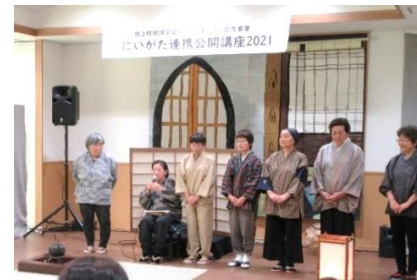
かしわざき語り部の会の皆さん