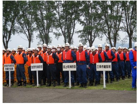
★信濃川流域の各地域の消防団、国土交通省、建設組合など多くの団体が参加して毎年行われています。

◆積土のう工の目的 洪水によって堤防が沈下した場合や増水する速さが著しく、水が堤防を越えるおそれがあるときに用います。